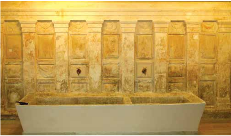
Φωτ. 5. Οι κρήνες του τζαμιού της Βαλιντέ σουλτάνας...

δόθηκε η άδεια λειτουργίας σε ένα τόσο κεντρικό σημείο. Ένα σημείο λοιπόν αντίστοιχα κεντρικό με το εξεταζόμενο.