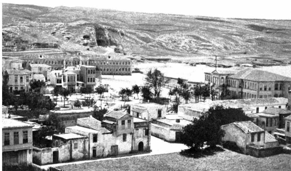
Φωτ. 2. Η πλατεία Σκρυδλώφ επί κρητικής πολιτείας (ταχυδρομική κάρτα του Ρεθυμνίου εκδότη Γ. Δερμιτζάκη)