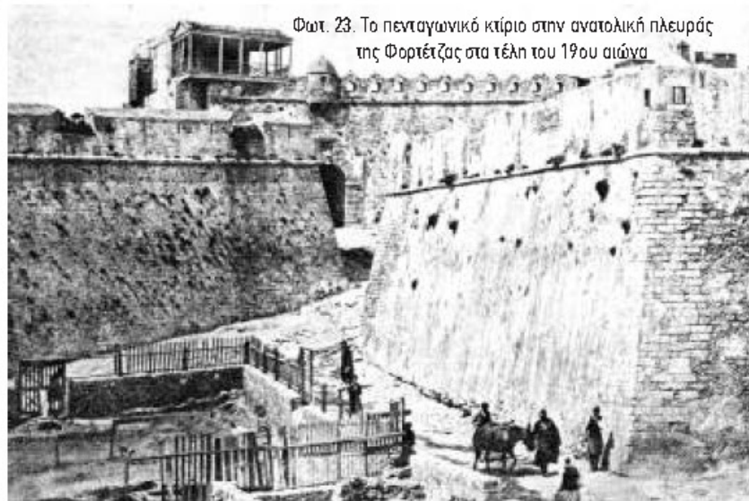
Φωτ. 23. Το πενταγωνικό κτίριο στην ανατολική πλευράς της Φορτέτζας στα τέλη του 19ου αιώνα