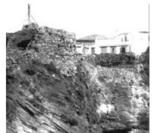
Φωτ. 26. Ερείπια από το βόρειο τείχος του Φρουρίου του Μυλοποτάμου