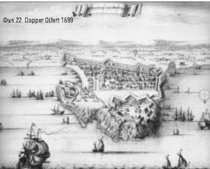
Φωτ. 22. Dapper Olfert 1688