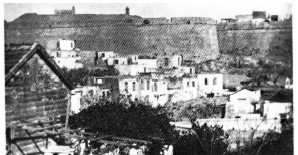
Φωτ.21. Ο προμαχώνας του Αγ.Λουκά της Φορτέτζας από τα νότια