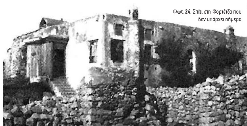
Φωτ. 24. Σπίτι στη Φορτέτζα που δεν υπάρχει σήμερα

Η αίσθηση ότι μιά νέα εποχή ξεκινά είναι διάχυτη στα δημοσιεύματα καθώς και η άπο-