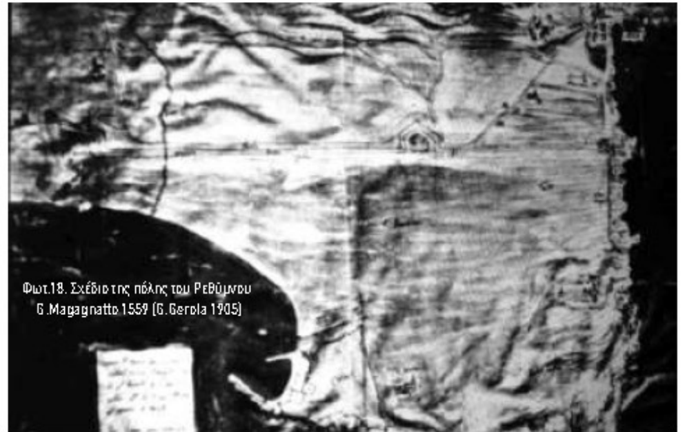
Φωτ.18. Σχέδιο της πόλης του Ρεθύμνου G. Magagnatto 1559 (G. Gerola 1905)

Για την περιγραφή της οχύρωσης ο Gerola δανείστηκε ένα σχέδιο στο οποίο απεικονιζόταν μιά επίθεση των βενετών στα 1647, όταν ήδη είχε πέσει στα χέρια των Τούρκων.