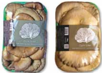
Φρέσκα μανιτάρια πλευρώτους & πλευρώτους φιλέτο CULTA TERRA σκαφάκι

E-mail: cultaterra@gmail.com www.facebook.gr/cultaterra/