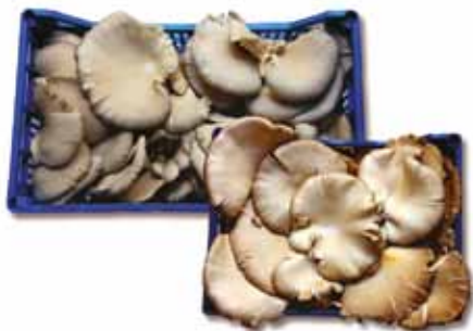
Φρέσκα μανιτάρια πλευρώτους & πλευρώτους φιλέτο CULTA TERRA χύμα