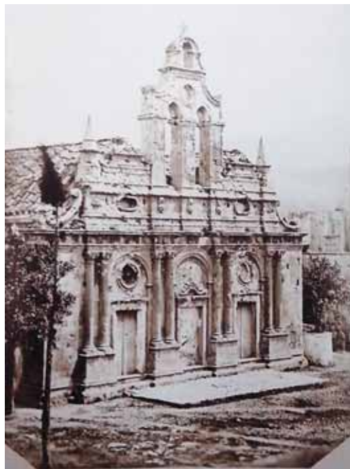
Chiesa di Arcadi