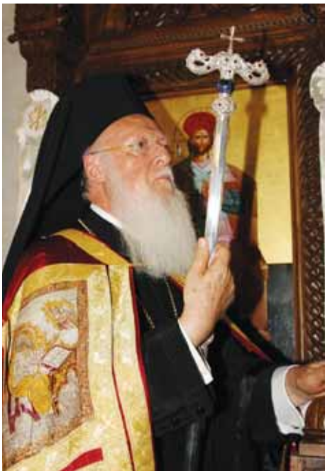
Ἡ Αὐτοῦ Θειοτάτη Παναγιότης ὁ Οἰκουμενικός Πατριάρχης κ.κ. ΒΑΡΘΟΛΟΜΑΙΟΣ ἐπὶ τοῦ Ἀρχιερατικοῦ Θρόνου τῆς Ἱερᾶς Μονῆς Ἀρκαδίου κατὰ τὴν ἐπίσκεψιν Αὐτοῦ τὴν 3ην Σεπτεμβρίου 2012.