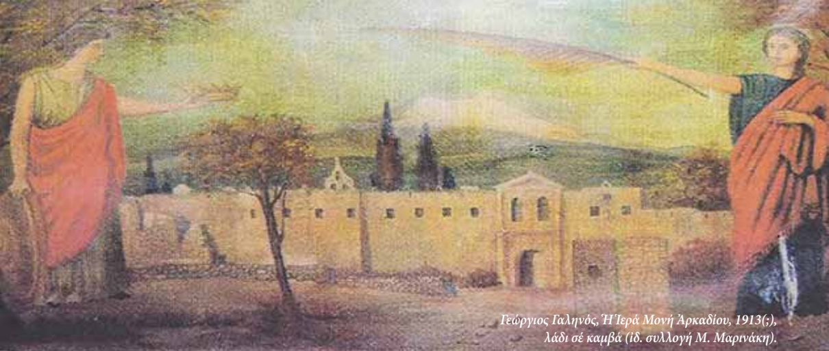
Γεώργιος Γαληνός, Ἡ Ἱερά Μονή Ἀρκαδίου, 1913(·), λάδι σέ καμβά (ιδ. συλλογή Μ. Μαρινάκη).