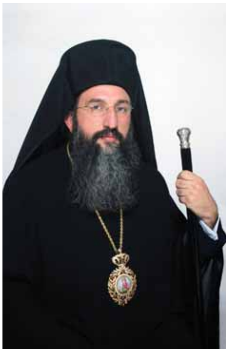
Ὁ Μητροπολίτης Ρεθύμνης καὶ Αὐλοποτάμου Εὐγένιος