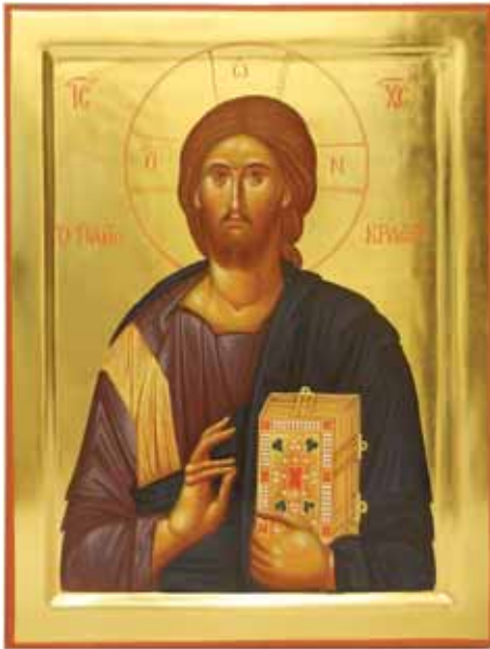
Εικόνα του Κυρίου ἡμῶν Ἰησοῦ Χριστοῦ, ἡ ὁποία φιλοτεχνήθηκε στήν Ἱερά Μονή Παντοκράτορος Ἁγίου Ὁρους καί φυλάσσεται στό Ἐπισκοπεῖο τῆς Ἱεράς Μητροπόλεώς μας.